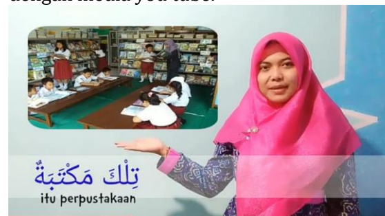
Figure 3: Guru menjelaskan materi dengan media you tube.

#hamidahnur #pembelajaranbahasarab #videoanak