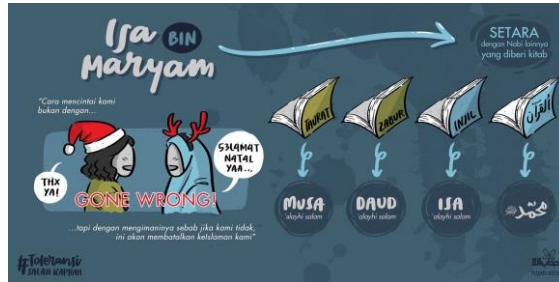
Gambar 4 Unggahan tentang Tasyabbuh