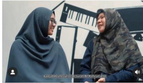
Gambar 6 Redaksi kata jelas