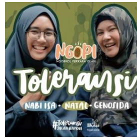
Gambar 3 Teaser Video