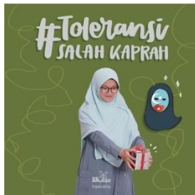
Gambar 2 Pembukaan Unggahan