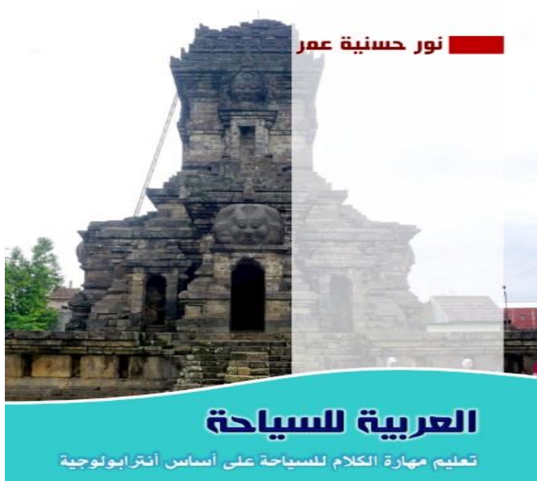
الصورة ١. صفحة غلاف الكتاب التعليمي