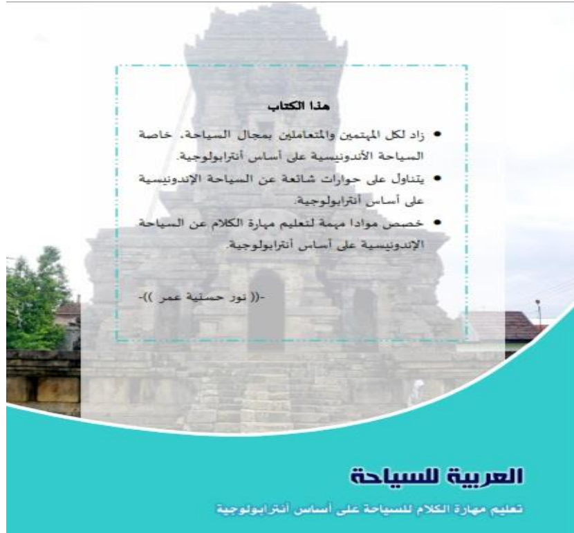
الصورة ٢. صفحة الغلاف النهائي

على أساس فعالية تطبيق كتاب تعليم مهارة الكلام المطور للسياحة على أساس أنثروبولوجيا في ترقية التحصيل الدراسي لدى الطلبة في فصل السياحة بقسم اللغة العربية وأدبها بجامعة مولانا مالك إبراهيم الإسلامية الحكومية مالانج في مادة السياحة، حصلت الباحثة على النتائج لكل الاختبارين القبلي والبعدي، وقائمة النتائج كما في الملاحق من هذا البحث. فمنها يتضح للباحثة: أولاً : في الاختبار القبلي، إن الطلاب في فصل السياحة نالوا الدرجة المعدلة ٧٣،٢٦ معنى ذلك أن قدرة الطلاب مهارة الكلام عن السياحة في المستوى مقبول. ومن هنا فإن كفاءة الطلاب الأساسية في مهارة الكلام عن السياحة بصفة عامة مقبول. والثاني: في الاختبار القبلي، ١٦ طالباً حصلوا على درجة جيد، ٢٠ طالباً من حصلوا على درجة مقبول، و ١٤ طالباً حصلوا على درجة ناقص. الثالث : في الاختبار البعدي، إن الطلاب نالوا الدرجة المعدلة ٨٣،٣٢ معنى ذلك أن قدرة الطلاب في مهارة الكلام عن السياحة في المستوى جيد، ومن هنا إن قدرة الطلاب في مهارة الكلام عن السياحة بصفة عامة جيد. الرابع : في الاختبار البعدي، يوجد أن ٦ طلاب حصلوا على درجة جيد جداً، و ٣٥ طالباً من حصلوا على درجة جيد، و ٩ طالباً حصلوا على درجة مقبول. والخامس: من البيانات السابقة قد اتضح للباحثة درجة الطلاب في الاختبار القبلي والبعدي.