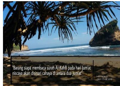
Gambar2; Keutamaan membaca Qs. Al-Kahf.