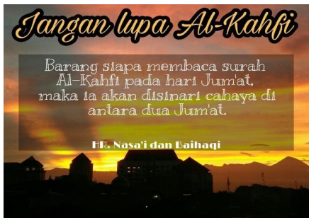
Gambar1; Keutamaan membaca Qs. Al-Kahf.

Dengan kata lain, aktivitas posting meme hadis dalam hal ini lebih bernuansa religius dibandingkan nuansa politis, meskipun pada akhirnya berimbas pula pada munculnya identitas kesalehan yang khas. Berikut ini adalah tampilan dari postingan hadis keutamaan membaca Qs. Al-Kahf yang bisa ditemukan setiap malam atau pagi hari Jumat.