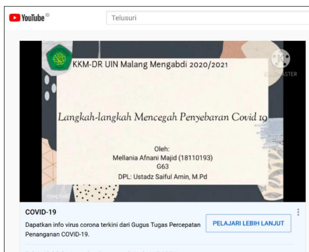
Gambar 10 Tampilan Video Pencegahan Covid-19

Selain dalam bentuk spanduk dan poster, pencegahan covid-19 disosialisasikan dalam bentuk video pendek. Video pendek tentang pencegahan virus covid-19 disebarakan melalui youtube pada link: https://youtu.be/HLR2moOojwo dan Instagram pada link: https://www.instagram.com/tv/CKdJqWyjjF/?igshid=1s9cfgoymoozs . Sosialisasi pencegahan penularan covid-19 melalui media ini dirasa cukup efektif, mengingat pada masa pandemi ini tidak dianjurkan untuk kontak secara langsung. Dukungan masyarakat yang sebagian besar memiliki HP/Android, menjadikan sosialisasi di bidang kesehatan menjadi lebih mudah dan menyeluruh (Mutia, Cholifah, & Yulianingsih, 2020).