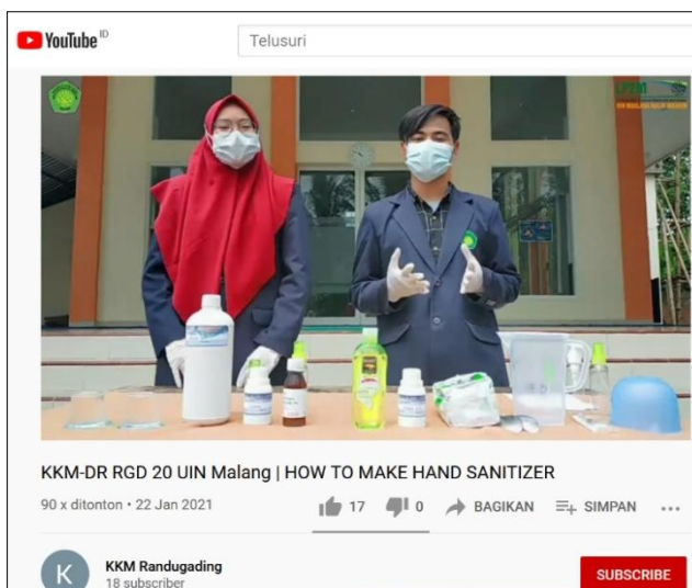
Gambar 11 Tampilan Video Membuat Hand Sanitizer

Video pendek tentang tutorial cara pemakaian hand sanitizer disebarakan melalui youtube pada link: 1) ( https://youtu.be/ljF4mJdZf2k dan 2) https://www.youtube.com/watch?v=GO9aYa_JrVY&feature=youtu.be serta penggunaan masker yang benar pada link: https://youtu.be/_jN8P1d6u6A .