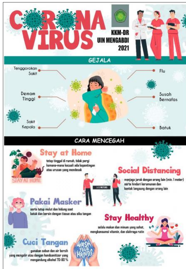
Gambar 8 Contoh Poster Pencegahan Virus Covid-19 Oleh Alfin Hidayat (Grup-63)