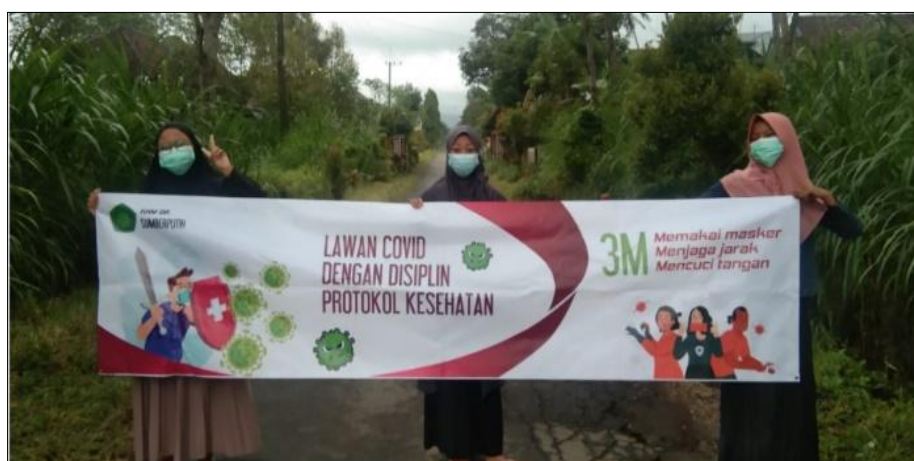
Gambar 7. Pemasangan Spanduk di Desa Sumber Putih, Kec. Tajinan, Kab Malang