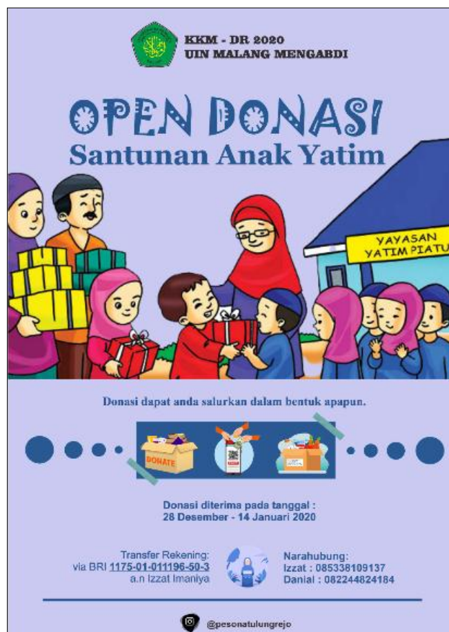
Gambar 16 Bantuan Donasi Secara Online