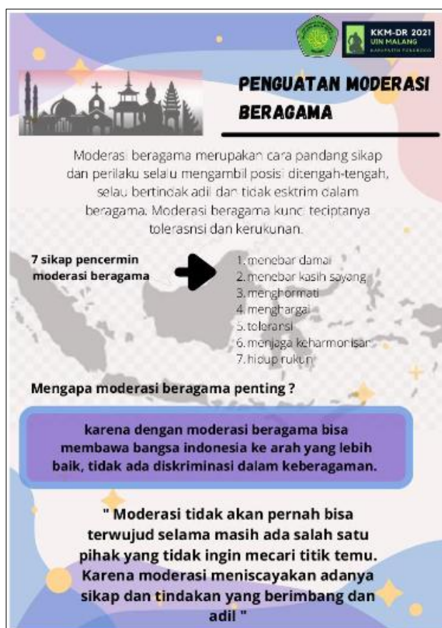
Gambar 1 Poster Moderasi Beragama

Salah satu contoh poster moderasi beragama oleh grup 63 dapat dilihat pada gambar 1. Dalam poster tersebut dijelaskan mengenai arti moderasi beragama, 7 sikap yang mencerminkan sikap moderasi beragama, serta pentingnya moderasi beragama untuk menjaga kerukunan umat beragama di Indonesia (Kementerian Agama RI, 2019). Poster tersebut diunggah ada media-media sosial seperti Instagram yang dapat dilihat pada link: https://www.instagram.com/p/CKgrVrZjU_G/?igshid=1mhl56qoum80q .