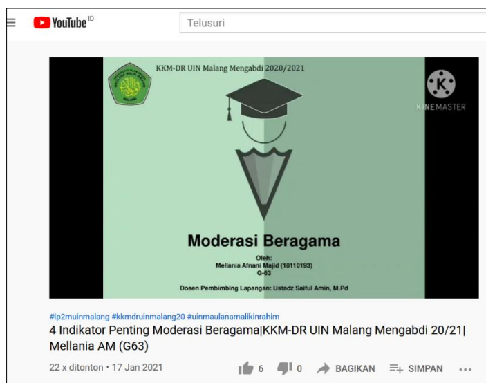
Gambar 2 Tampilan Video Moderasi Beragama