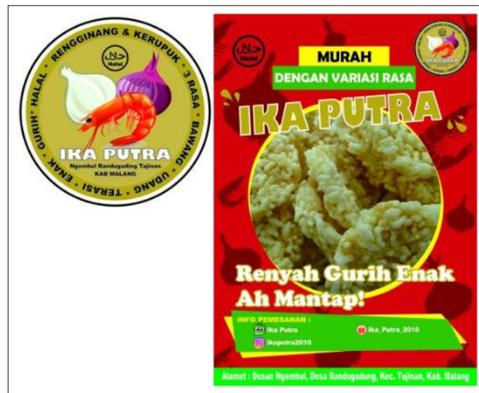
Gambar 12 Contoh Logo dan Desain Pada Kemasan Produk Hasil Olahan

Bentuk program peningkatan kualitas produk ekonomi dapat berupa 1) pembuatan logo dan desain pada kemasan produk hasil olahan dan 2) strategi penjualan produk secara online baik yang ada di UMKM maupun home industri di masing-masing daerah tempat pengabdian. Upaya penggunaan digital marketing di masa pandemi ini dapat membantu meningkatkan ekonomi masyarakat (Candra, Hendy, Pratikto, Gunarto, & Sumargono, 2021; Rahmatika, Dhika, & Isnain, 2020). Sebagai contoh yang dilakukan oleh peserta grup-63 yang bernama Olyvia Aprelian dan Suprapti.