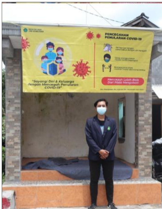
Gambar 6. Pemasangan Spanduk di Dusun Petungombo, Desa Sepawon, Kec. Plosoklaten, Kabupaten Kediri