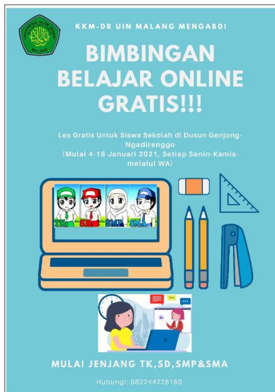
Gambar 15 Bimbingan Belajar Online