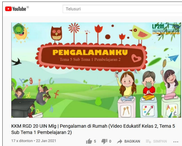
Gambar 14 Materi Pelajaran Secara Virtual/Online

Bentuk-bentuk program ini yang telah dilaksanakan oleh beberapa peserta grup-63, yaitu 1) membuat materi pelajaran secara virtual/online oleh Suprapti; 2) membuat bimbel secara online oleh Olyvia Aprelian; dan 3) bantuan donasi kepada anak yatim secara online oleh Arfiatul Aliyah.