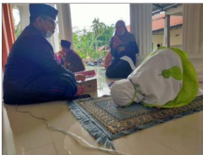
Gambar 5 Kegiatan Lomba Praktik Sholat