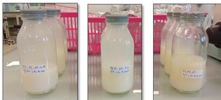
Gambar 1. Sediaan Hair emulsion Minyak Biji Chia