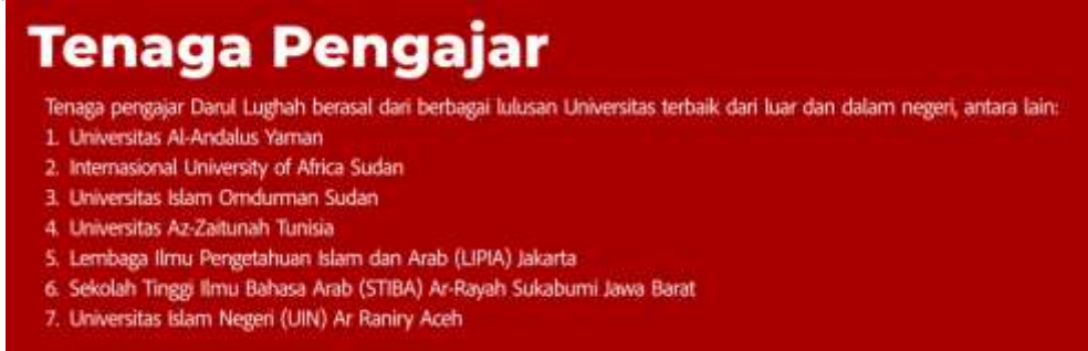
Gambar 1. Tenaga pengajar yang dikutip dari Brosur Darul Lughah

"في برنامج اللغة بدار اللغة، يتكون من ثلاث مستويات، وهي الابتدائي، والمتوسط والمتقدم. لكل مستوى فصلين (فصل الأخوات وفصل الإخوان). عند مستوى الابتدائي أربع أساتذة إما في فصل الإخوان هناك اثنين أستاذان، أستاذا واحدا لتعليم أربع مهارات وأستاذا للاستماع المراجعة في الليل. في فصل الأخوات هناك أستاذتان، أستاذة واحدة لتعليم أربع مهارات وأستاذة لمراجعة المادة في الليل. على مستوى المتقدم يتكون إلى ست أساتذة، أما في فصل الإخوان هناك ثلاث أساتذة، وأستاذا واحدا لتعليم أربع مهارات وفي يوم الخميس استحضر عربي من معهد خادم الحرمين أتشيه وأستاذة واحدة لمراجعة المادة في الليل". يكمل المعلم في هذا البرنامج أربعة عشر معلما، معظمهم خرجي من الشرق الوسط كمثل من اليمن، السودان وتونس. وهناك بعضهم خرجي من داخلية كمثل من معهد العلوم الإسلامية والعربية بجاكرتا، معهد الراية بسوكابومي ومن جامعة الرانيري. وأخرجهم خرجي من المعاهد. في برنامج 60 hari lancar berbahasa Arab، تنقسم هذه الدورة إلى 3 مجموعات فصول، وهي فصول الابتداء والمتوسط والمتقدم، جانب ذلك أن المحاضرين هم من خريجي الجامعات سواء من الخارج أو داخل الدولة. وهذا ما تؤكد بنتائج الشكل الصورة 3 كما يلي: