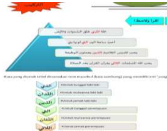
الصورة ٣: الأسماء الموصولة في الدرس الخامس

عرض الباحث نموذجاً لمحتوى التراكيب النحوية في كتاب "اللغة العربية" للصف التاسع المتوسط، وذلك من خلال العرض التالي: 13