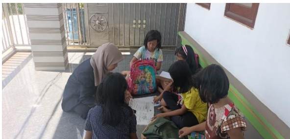
Gambar 1. Kegiatan one-on-one coaching

Berikut adalah dokumentasi yang kami ambil dari program bimbingan belajar gratis yang kami adakan di posko KKN 89 :