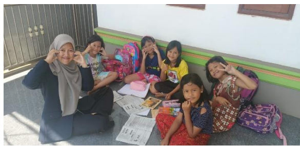
Gambar 2 : Kegiatan one-on-one coaching