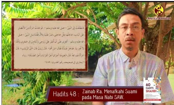
Gambar 2. Pembacaan dan penjelasan hadis pada video “Ngaji Hadits Perempuan ke-48: Zaynab Ra. Menafkahi Suami pada Masa Nabi SAW”

tersebut berdasarkan teks. Lebih lanjut, ia menerangkan bahwa terjadi dialog antara Zaynab dengan suaminya tentang siapa yang mendatangi Nabi. Kemudian, Zaynab menghampiri Nabi dan bertanya tentang apakah perempuan ketika memberi nafkah dan sedekah kepada suami serta anak-anak itu memperoleh pahala atau tidak. Nabi menjawab bahwa orang yang bersedekah kepada keluarga dan kerabat akan memperoleh dua pahala. Orang yang bersedekah dan memberi nafkah kepada orang yang membutuhkan seperti istri, suami, dan anak-anak adalah orang yang akan memperoleh dua pahala. 38 Konteks hadis tersebut mengisyaratkan bahwa Zaynab merupakan kepala rumah tangga yang bertanggung jawab atas kecukupan ekonomi keluarga. Peran seperti ini ditegaskan dalam hadis tersebut yang kemudian diapresiasi oleh Nabi. 39