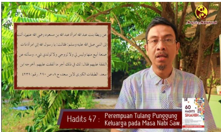
Gambar 1. Pembacaan dan penjelasan hadis pada video “Ngaji Hadits Perempuan ke-47: Perempuan Tulang Punggung Keluarga pada Masa Nabi SAW”