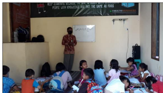
Gambar 1. Penjelasan materi pelatihan dengan metode ceramah dan pemberian contoh

Kegiatan pelatihan berlangsung selama enam kali, setiap hari Minggu pukul 08.00-10.30 WIB di Omah Wacan Malang. Metode pelatihan yang digunakan secara teknis berbentuk metode ceramah, pemberian contoh, tanya jawab, dan diakhiri dengan praktek menulis. Setelah praktek, narasumber mengevaluasi tulisan peserta satu per satu. Pertemuan diakhiri dengan penjelasan kesalahan umum yang terjadi pada para peserta, dengan harapan semoga kesalahan tersebut tidak terjadi di waktu-waktu berikutnya.