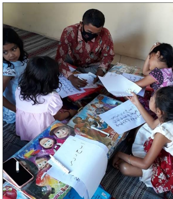
Gambar 3. Evaluasi tulisan peserta satu persatu