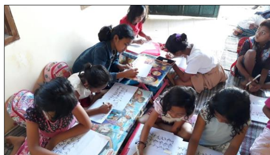
Gambar 2. Peserta melakukan praktek menulis