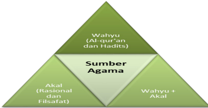
Gambar 2 Sumber agama menurut Ibn Rusyd