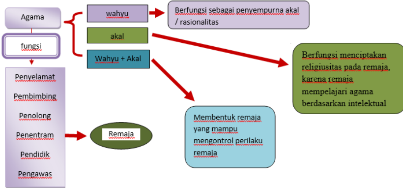
Gambar 4 Hasil pembahasan fungsi/peran agama