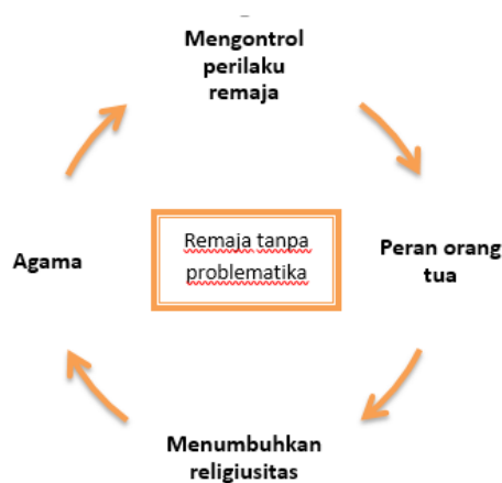
Skema 3 Peran penting agama dalam masalah remaja

Ditinjau dari peran orang tua terhadap permasalahan remaja, maka remaja membutuhkan peran orang tua karena peran lembaga pendidikan dan peran agama dapat berjalan ketika peran orang tua terpenuhi. Dalam artian orang tua memberikan bimbingan pendidikan dan agama kepada para pemuda terlebih dahulu. Ingatlah bahwa orang tua adalah sekolah pertama anak. Selain itu, pendidikan formal juga menjadi pilihan yang banyak digunakan untuk memecahkan permasalahan remaja. Karena remaja yang menempuh pendidikan formal cenderung melalui proses pendewasaan yang lebih fundamental dan mendasar, maka dapat dikatakan bahwa masa remaja merupakan masa transisi dimana seseorang berpindah dari masa kanak-kanak menuju dewasa.