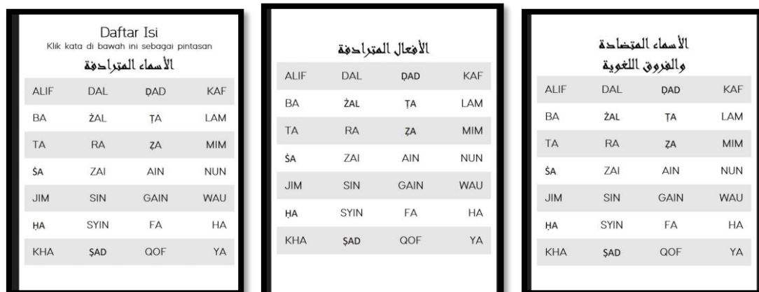
Gambar A.4 Petunjuk Penggunaan Kamus

Petunjuk penggunaan kamus ialah hal terpenting yang ada dalam sebuah kamus. Hal ini dimaksudkan agar memudahkan pembaca dalam mencari kosakata di dalam kamus. Dalam kamus Saluni Wal Mutaradifat Wal Ma’ani disusun berdasarkan urutan huruf hijaiyah yang dikelompokkan dari sinonim kata benda atau isim kemudian sinonim kata kerja atau fi’il. Pada penyusunan sinonim dan furuq lughawiyah juga disusun menjadi satu dengan urutan huruf hijaiyah.