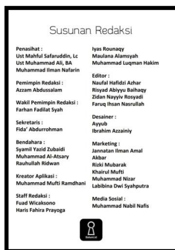
Gambar A.8 Susunan redaksi kamus

Dalam kamus Saluni Wal Mutaradifat Wal Ma'ani tidak memaparkan secara jelas tentang biografi penyusun, hanya disebutkan tim-tim penyusun redaksi kamus, mulai dari penasihat hingga staff produksi.