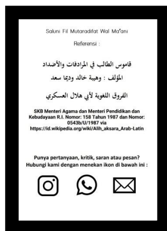
Gambar A.3 Sumber yang digunakan

Sumber yang digunakan dalam penyusunan kamus ini adalah kamus pelajar al-murodifat wal adh-daadu yang disusun oleh Kholid Wadiman Sa'ad dan penyusunan furuq al-lughawiyah merujuk pada Imam Abu Hilal Al-Askari.