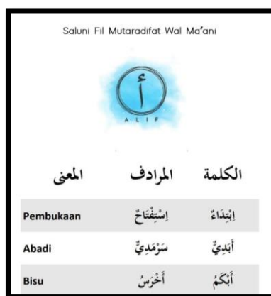
Gambar A.7 Font yang digunakan

Font (khat) yang digunakan dalam penyusunan kamus Saluni Wal Mutaradifat Wal Ma'ani adalah Traditional Arabic, sedangkan penulisan arti menggunakan font Arial untuk kosakata bahasa Indonesia.