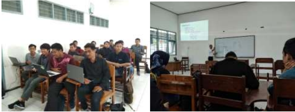
Gambar 1 Suasana pelaksanaan blended learning & teacher-centered learning di kelas

Untuk mengetahui peningkatan pemahaman mahasiswa terhadap materi yang disampaikan menggunakan kedua metode pembelajaran, setelah perkuliahan di kelas mahasiswa diminta untuk mengerjakan post-test . Untuk mendapatkan hasil yang valid, post-test dilaksanakan di luar kelas mulai setelah perkuliahan tatap muka selesai sampai dengan sebelum perkuliahan berikutnya. Post-test menggunakan model multiple choice dengan jumlah 10 soal diacak dari 30 bank soal pada setiap topik nya. Pada metode perkuliahan blended learning , mahasiswa dapat mengakses materi perkuliahan yang disediakan di Learning Management System , sedangkan pada metode perkuliahan Teacher-Centered Learning mahasiswa tidak dapat mengakses materi perkuliahan kecuali catatan yang dibuat selama perkuliahan. Hasil dari post-test tersebut dapat langsung diketahui oleh mahasiswa setelah mereka melaksanakan post-test .