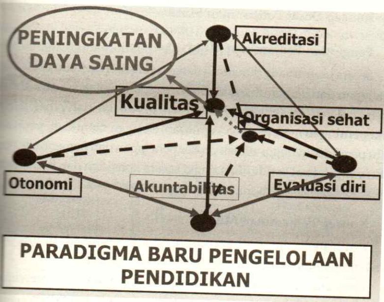
Gambar 1. Paradigma Baru Pengelolaan Pendidikan Tinggi

Agar eksistensinya terjamin, maka perguruan tinggi mau tidak harus menjalankan penjaminan mutu pendidikan tinggi yang menggarakannya. Perlu dikemukakan, karena penilaian stakeholders senantiasa berkembang, maka penjaminan mutu juga harus selalu dilakukan pada perkembangan itu secara berkelanjutan ( continuous improvement ). 3