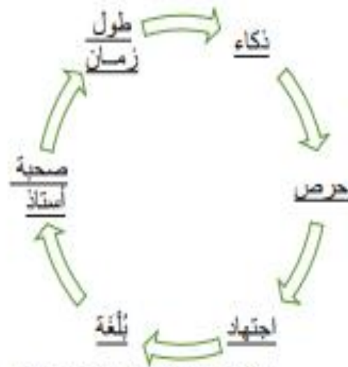
شكل 1: عناصر العقيدة في أركان عملية التعليم عند الشافعي

أعلم أن تعلم العلم الإسته ذكاء وحرص واجتهاد وبلغه سائلك عن توصيلها ببيان وصحة استناد وطول زمان