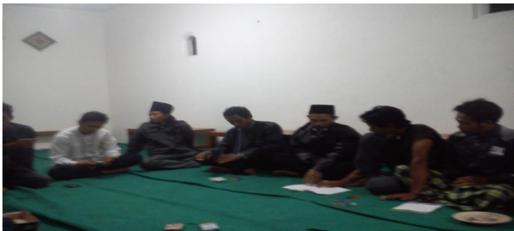
Gambar 5 Bentuk Pendampingan 1