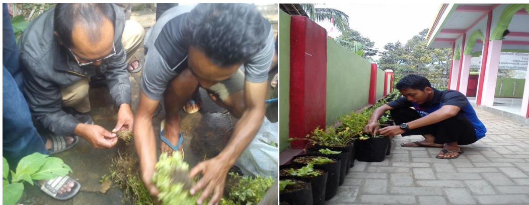
Gambar 3 Penghijauan masjid