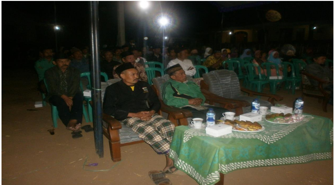
Gambar 10 Proses Pendampingan dan Penutupan KKM kelompok 237 Posdaya “Bonjagung Sejahtera” Berbasis Masjid Hasanuddin Dsn. Bonjagung, Ds. Pait, Kec. Kasembon UIN Maulana Malik Ibrahim Malang