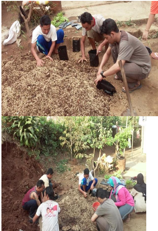
Gambar 2 Pembuatan Kebun Gizi