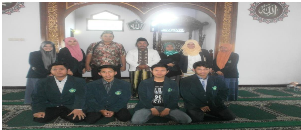
Gambar 8 Bentuk Pendampingan dan Penyerahan Kembali Mahasiswa KKM ke UIN Maulana Malik Ibrahim Malang