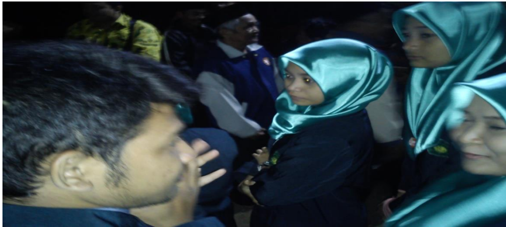
Gambar 6 Bentuk Pendampingan 2