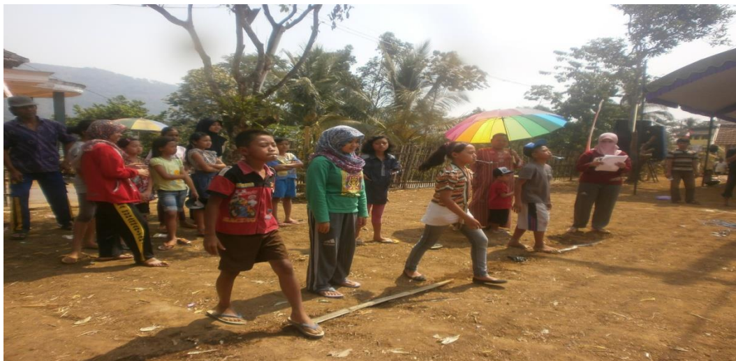
Gambar 9 Proses Pendampingan pada Lomba Perayaan HUT Kemerdekaan RI ke-70 KKM kelompok 237 Posdaya “Bonjagung Sejahtera” Berbasis Masjid Hasanuddin Dsn. Bonjagung, Ds. Pait, Kec. Kasembon UIN Maulana Malik Ibrahim Malang

Terakhir, penyerahan laporan kegiatan Posdaya “Bonjagung Sejahtera” Berbasis Masjid Hasanuddin Dsn. Bonjagung, Ds. Pait, Kec. Kasembon pada tanggal 18 September 2015.