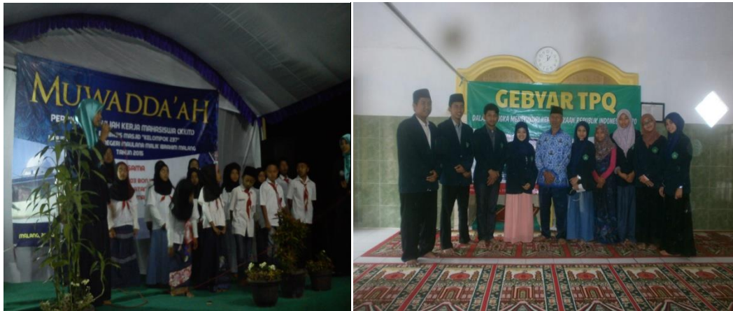
Gambar 7 Bentuk Pendampingan 3