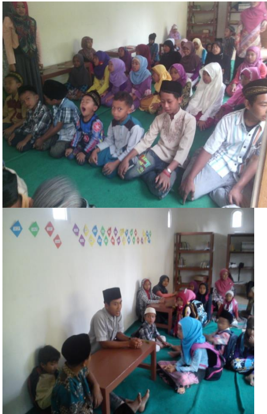
Gambar 4 Mengajar Sholat dan TPQ