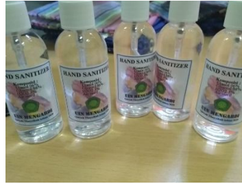
Gambar 2. Hasil praktek pembuatan Hand sanitizer sesuai standar WHO (Dok. Pribadi)

Kegiatan partisipasi “Tomat Estu” dengan cara memberikan bantuan kepada tiap RT yang sudah ada papan untuk menggantungkan bahan makanan. Papan untuk menggantung ini sudah ada sebelumnya, sehingga tim Pengabdian kepada Masyarakat tinggal mengisi saja. Slogan “Tomat Estu: adalah “boleh ambil seperlunya, boleh taruh seikhlasnya” akan mengajak masyarakat untuk saling meningkatkan solidaritas. Pada saat mengambil barang yang dibutuhkan, diharapkan adanya rasa sungkan apabila hanya sekedar mengambil barang. Sehingga masyarakat diharapkan akan tergerak untuk menaruh barang yang dimiliki. Selain itu masyarakat juga dapat saling bertukar barang yang mereka inginkan. Mereka bebas untuk meletakkan di cantolan “Tomat Estu”, dapat berupa kopi, beras, gula, detergen, minyak goreng, hingga hasil pertanian seperti kol, sawi, wortel dan lain sebagainya.